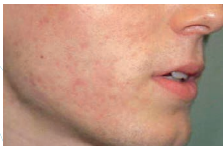
после курса салициловых пилингов